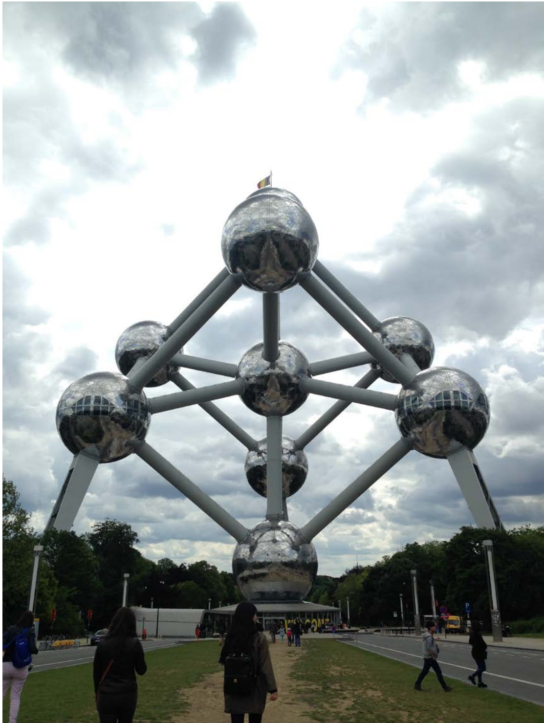
圖為位於比利時布魯塞爾的原子塔。