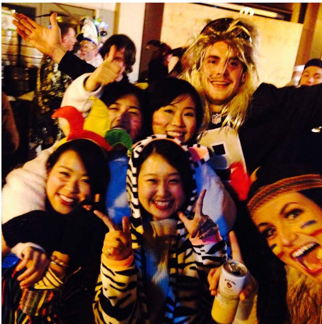
圖為二月份為期一週的嘉年華盛宴，每個人都精心打扮。