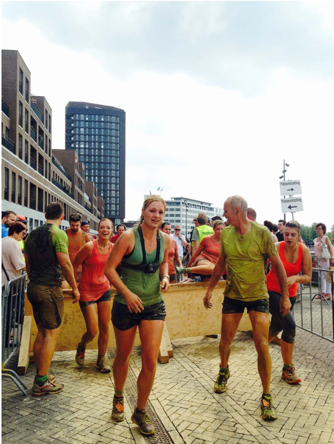
圖為 Venlo storm 在市中心的實拍，剛從泥灘關過來。