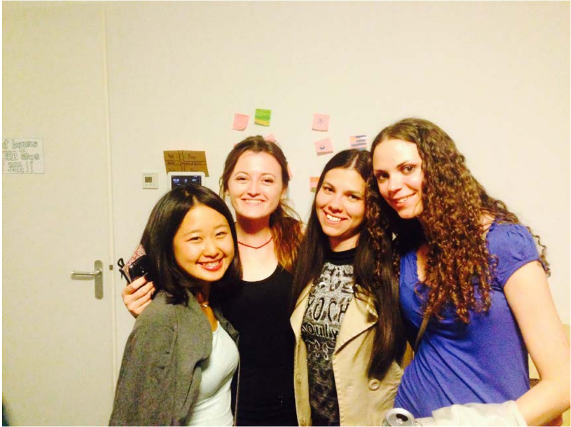
圖為在 Carpe diem 所舉辦的宿舍 party，由我與兩個匈牙利朋友與一位土耳其朋友的合照。