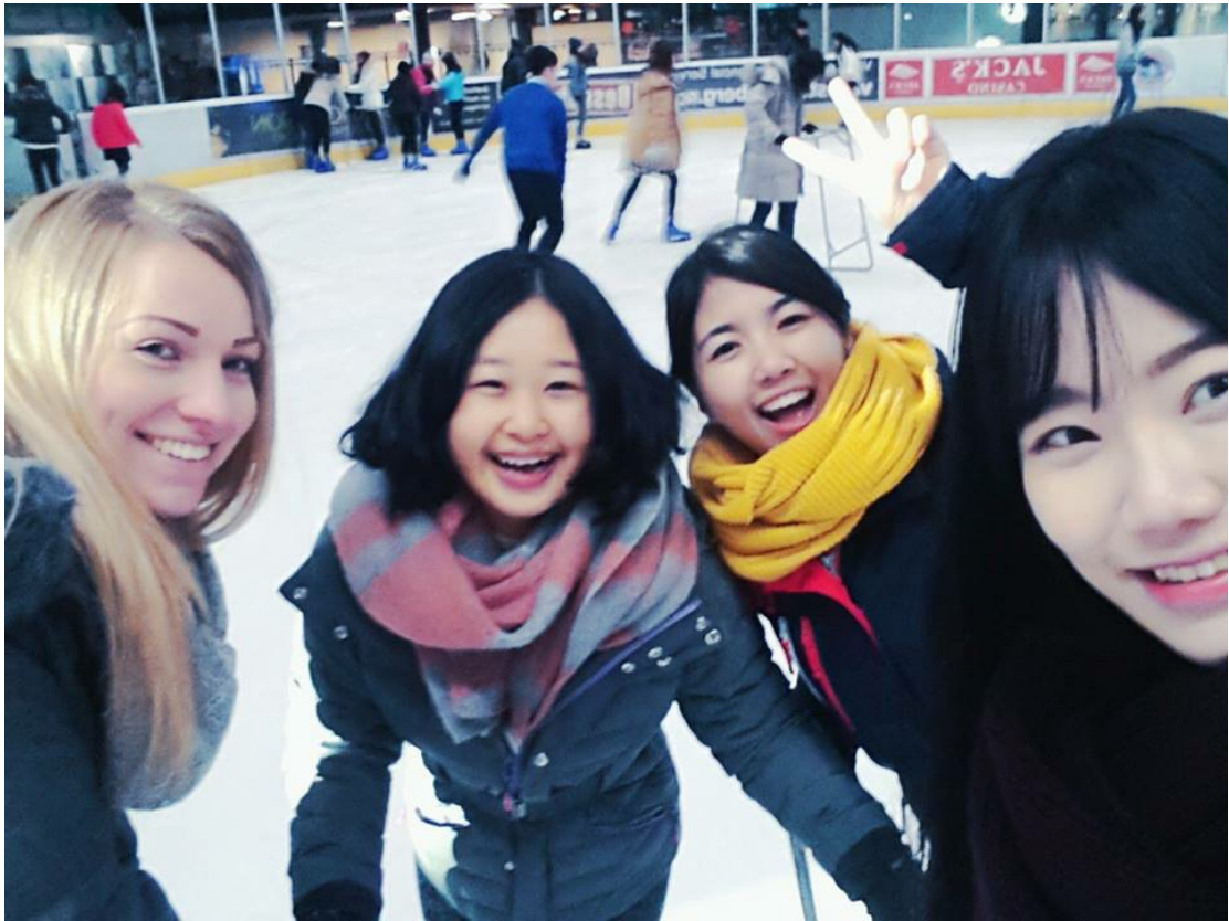
圖為開學第一週由學校主辦的活動，所有交換學生到 Eindhoven 體驗溜冰。