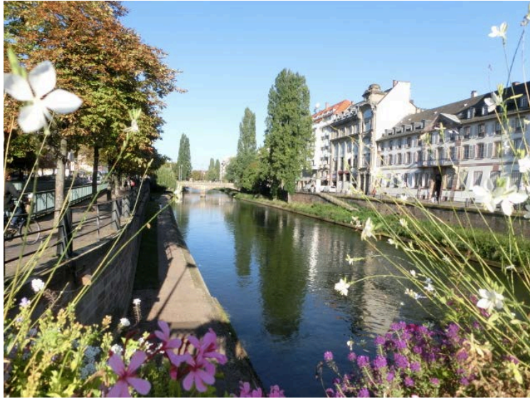
Paul Appell 宿舍