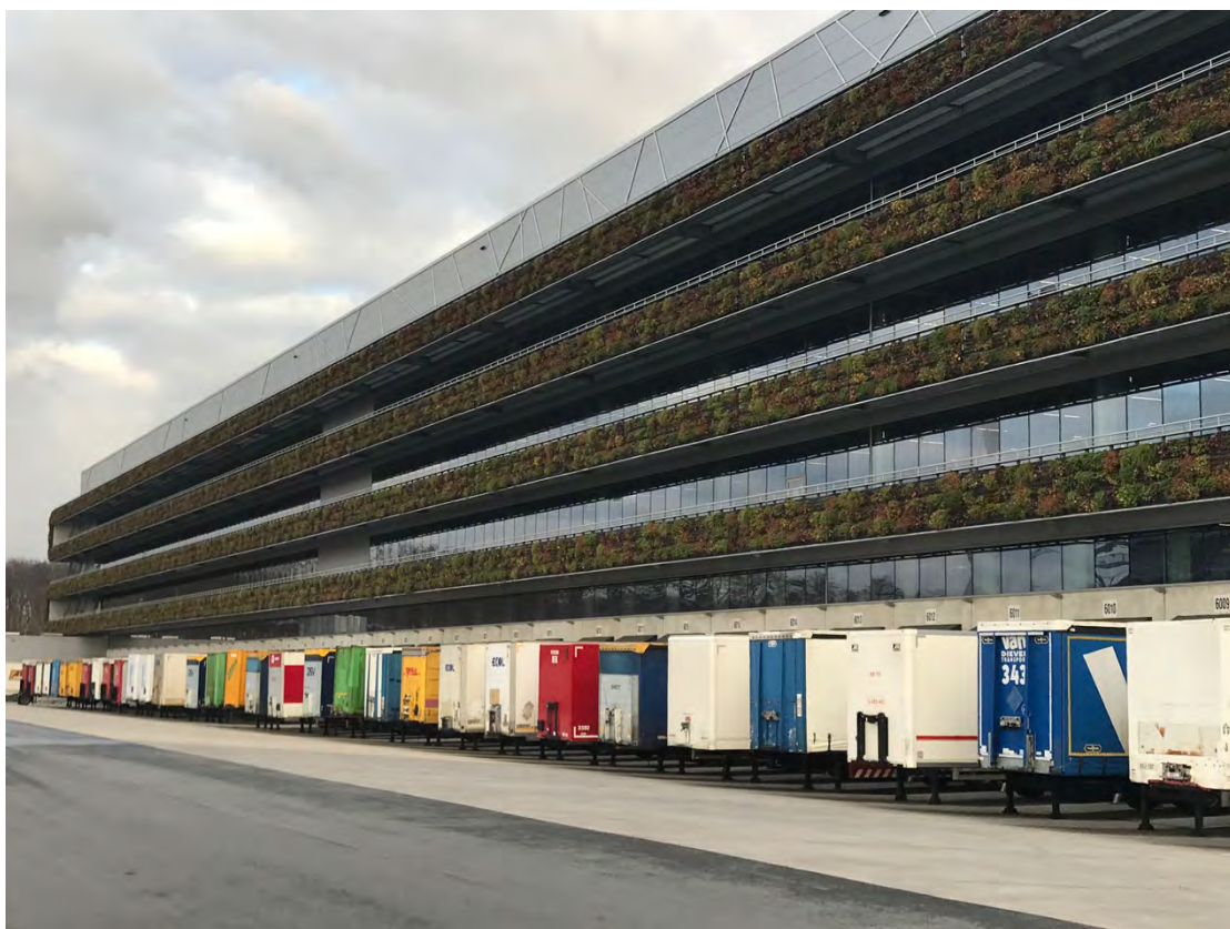
(圖四) Nike 歐洲倉儲及配送中心 (比利時布魯塞爾)