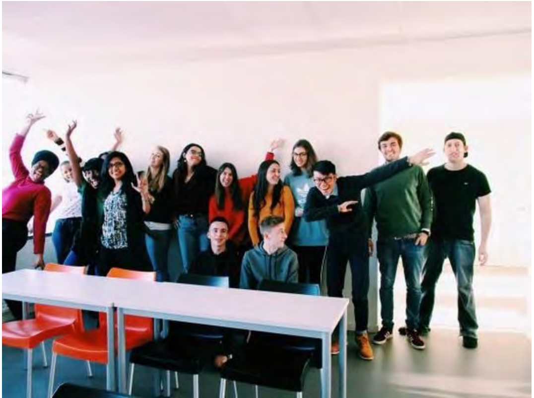
(圖一) 跨文化溝通技巧同學相處融洽