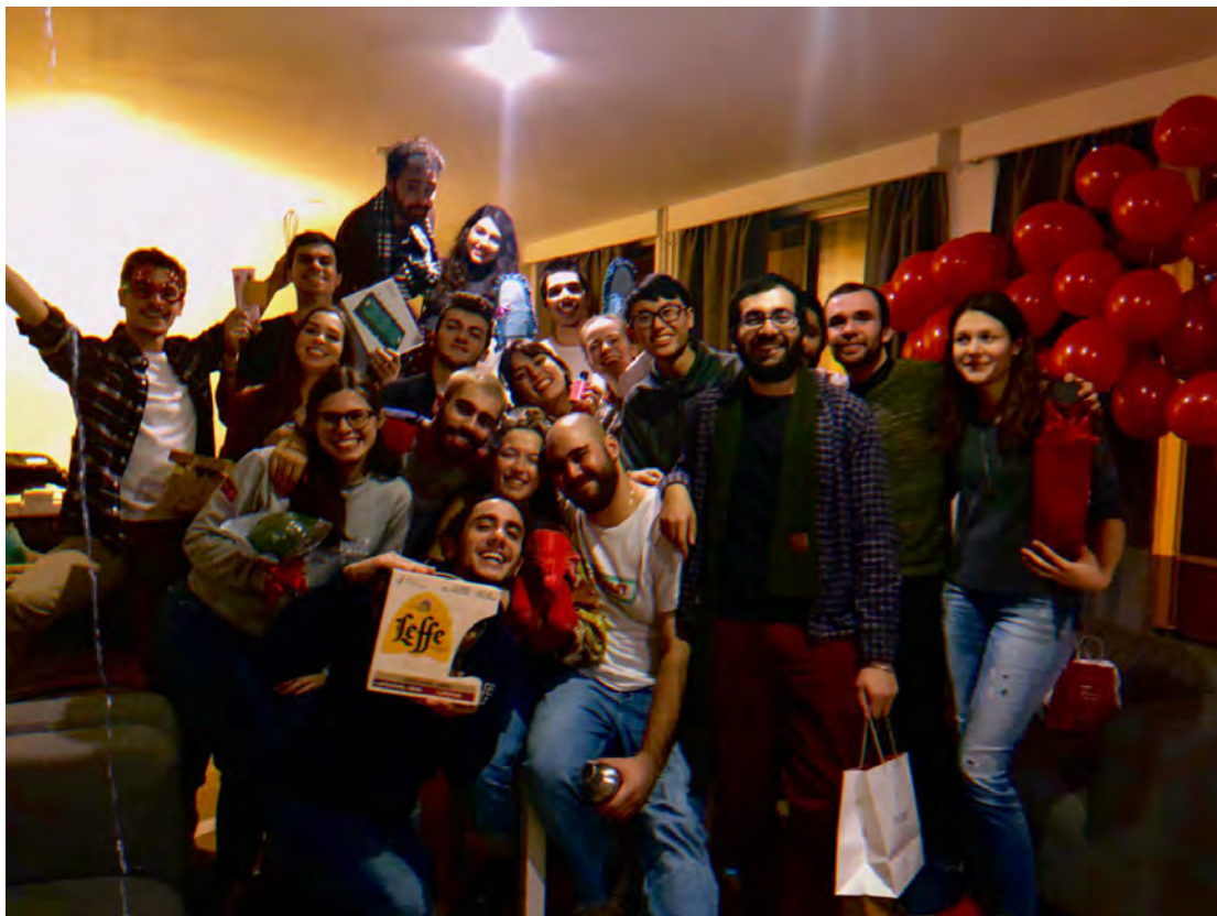
(圖六) 與國外的朋友、室友們舉辦的活動