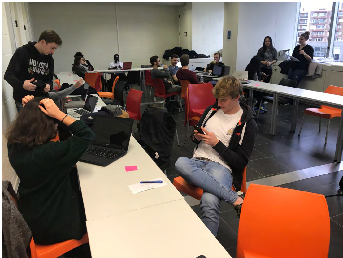
(圖三) speeddate 進行中