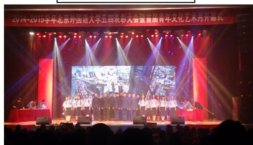
北京外國語大學團委之五四表彰大會