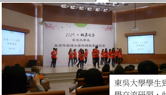
東吳大學學生到北京外國語大學交流研習，此張照片是晚會當天東吳學生所做的表演。