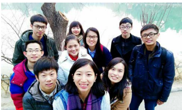
開學前與幾位大陸朋友出遊