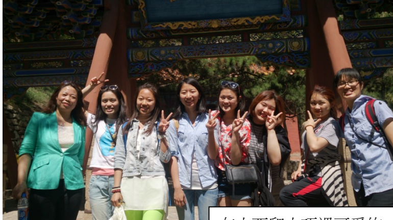
在山西爬山巧遇可愛的一家人 (爸爸幫我們合影)