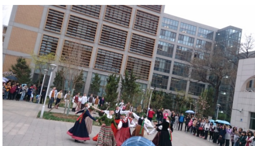
拉脫維亞民族舞蹈團精彩演出