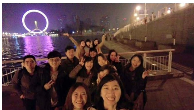
台灣交換生一同遊天津