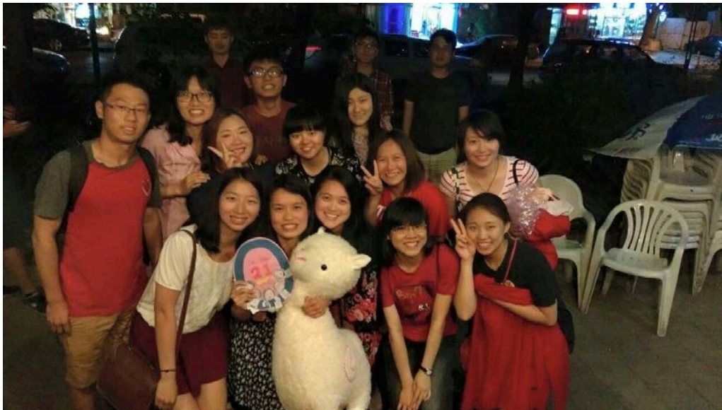
永生難忘的生日派對