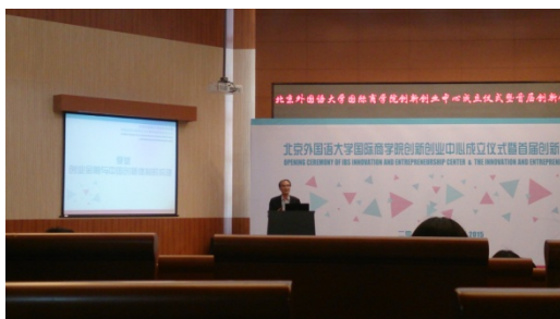
創新創業成立儀式兼創業論壇

學校每周都會舉辦許多不同類型的課外活動，包括演講、表演或是競賽等等，豐富我的校園生活。