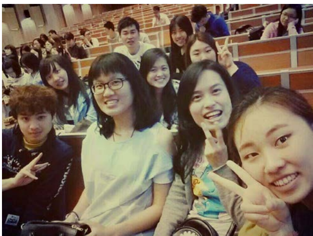
與兩位韓國女孩和一位日本男孩在學校看免費電影