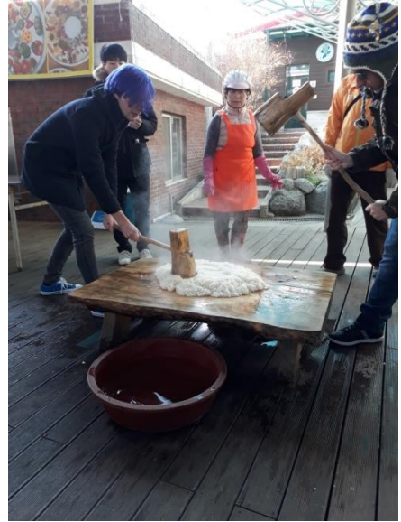
↑動手做泡菜與年糕