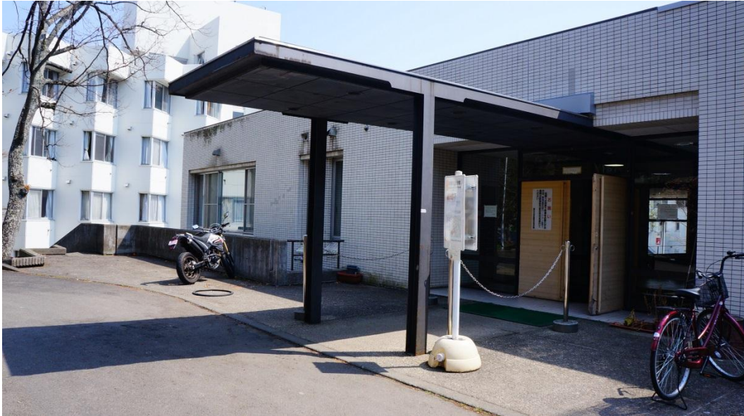
圖二:國際交流會館門口