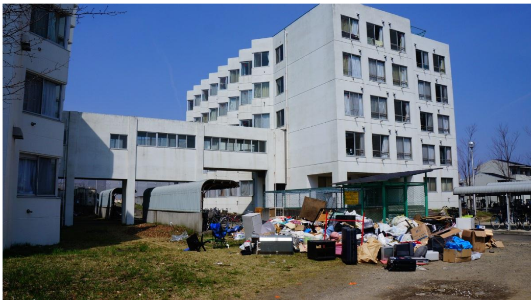
圖三:國際交流會館建築與垃圾場