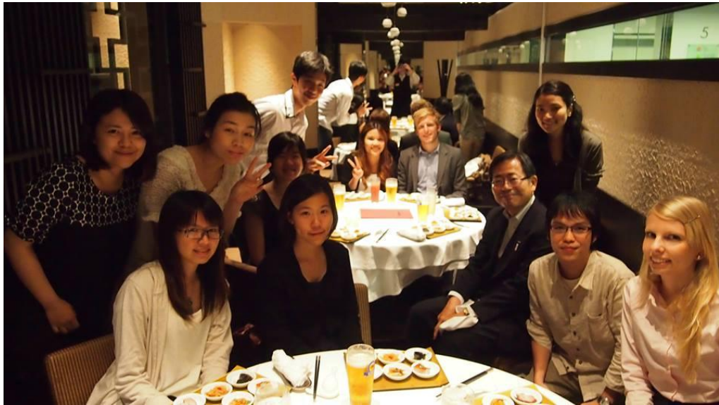
圖六:Career Development 期末聚餐