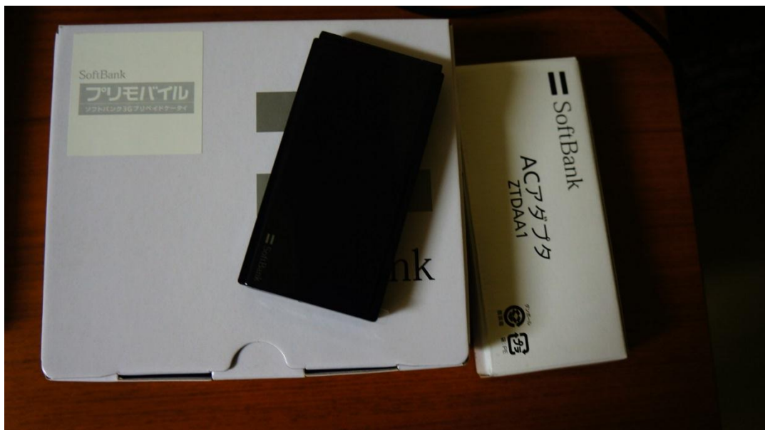
圖四:SoftBank Prepaid Phone

因為只交換半年期間，曾有考慮過不辦手機，就過原始人的生活。但考量到方便性，還是去軟體銀行Softbank辦了支Prepaid Phone。申辦手機需要國民健康保險證、學生證，每次預付金額為日幣三千或五千，可供使用兩個月，再加上日幣三百，可以無限傳簡訊，很多留學生選擇軟體銀行的手機是因為從凌晨一點到晚上九點這段期間，網內互打免費，但這點並不適用於Prepaid Phone，儲值日幣三千，約只能講15分鐘。故，解決之道為傳簡訊。值得注意，日本手機傳簡訊有兩種系統，一種是SMS，另一種為網路Mail，軟體銀行的稱之S Mail。若用Prepaid Phone傳簡訊給正常合約的手機號碼只能使用SMS，S MAIL則無法；再者，用Prepaid Phone傳簡訊給其他電信公司(DoCoMo與KDDI)，對方則收不到。