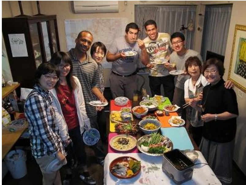
圖八:Group Mori 會話期末聚餐