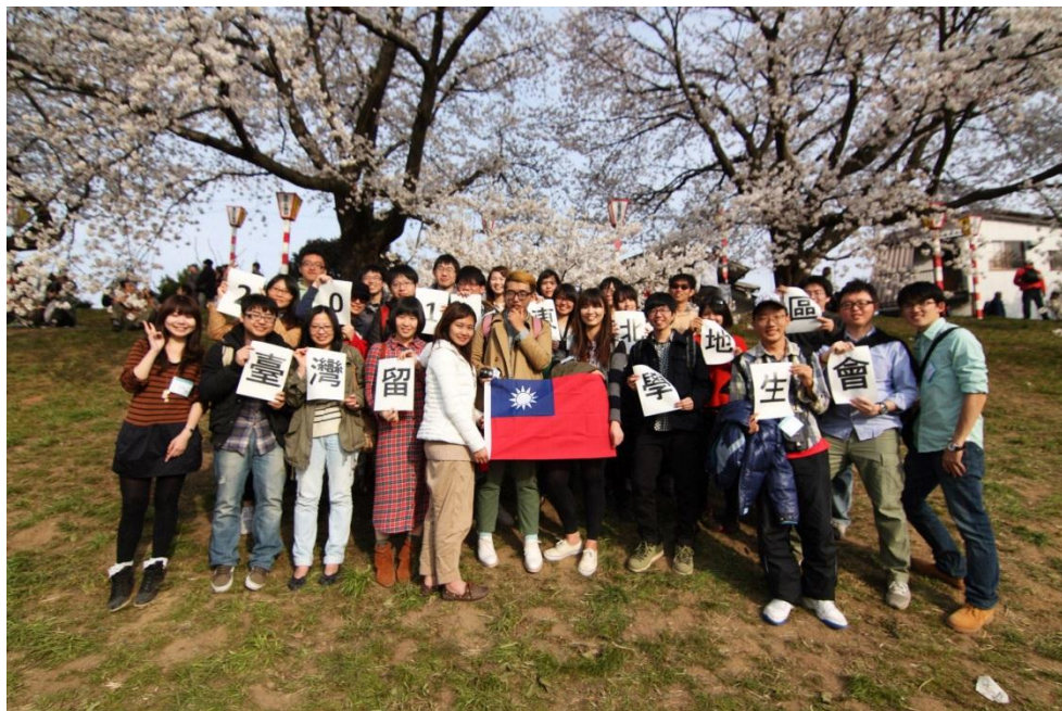
圖十一：於大河原船岡地區的迎新活動

仙台地區有個台灣留學生會，雖然主要活動區域為仙台，但整個東北地區的學生都是此學生會管轄範圍。學生會讓人有安心的感覺，畢竟在瑞典苑學品的台灣人少之又少。學生會不定期舉辦活動，如迎新與送舊。有問題也可以在學生會的社團網頁發問，大家都樂於為各位解惑。