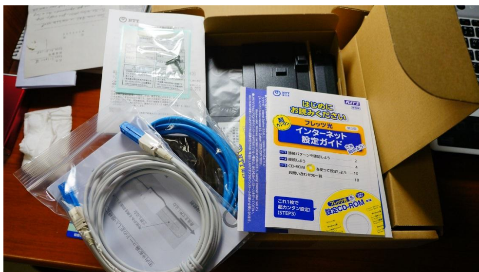
圖五：NTT 寄來的網路機盒

也得自行打電話向 NTT 與電信公司取消合約(確定退宿時間時，越早打電話越好)。NTT 會將包裹袋寄到宿舍，將網路機盒與配件放進袋子並送到郵局寄出即可，為一便民措施。