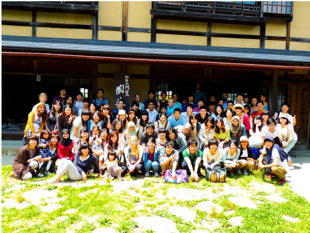
圖十：山形採櫻桃與陶藝體驗