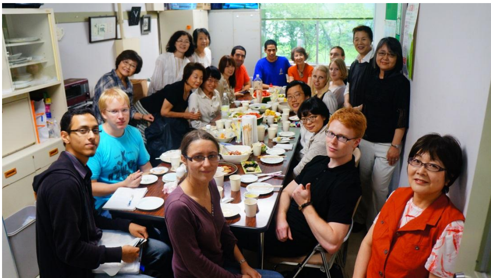
圖九:Group Mori Happy Talk Farewell Party

每周固定聚會時間為星期一、四，中午十一點到下午三點。有時會舉辦活動讓國際學生體驗日本文化，如摺紙、和服、押花、製作和食(わしよく)與歌舞伎表演欣賞等。