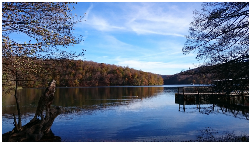
克羅埃西亞—十六湖國家公園

而我自己在這段交換期間，去了克羅埃西亞、波蘭、希臘、荷蘭等國家，除了在機票上能省錢之外，住宿方面我也都選擇青年旅館，除了加格很適合背包客之外，也能因此在旅行途中與來自世界各地的人交流，因此青旅可說是很棒的一個選擇。