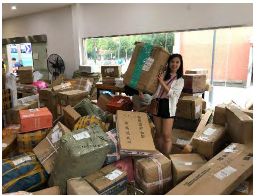
↑淘寶有活動時，貨物塞滿近鄰寶大廳