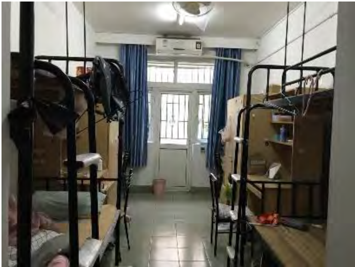
↑西南九宿舍內部(四人房床桌分離)，門外是陽台

(b). 本科生宿舍：我住的西南九樓，共六層樓，四人為一寢，室友皆為港澳台交換生，有公用衛浴(在一樓)、洗衣機(每層都有)、廚房(在一樓)、冰箱(在一樓)、熱水機(每層都有)。房內空間寬敞，號稱「公主樓」(大概 10 年前的號稱吧)，有冷水浴室、老舊洗手台(冰水)、半截門的蹲式馬桶、可曬衣服的陽台。有的房間是上床下鋪，也有的是床桌分離(我的就是這樣，睡上下鋪)。洗澡的話則是會到一樓的公共浴室，開放時間是 15-23 點，刷一卡通付錢才能洗澡，五分鐘 ¥1，固定溫度的熱水，有提供免費吹風機使用。洗衣機則是要用微信操作，公眾號「U 淨洗衣」付費使用。廚房有電磁爐、微波爐、冰箱免費使用，熱水機則是每層都有，自己刷卡付費打水，宿舍規定不能在寢室內使用熱水壺和大型電器(吹風機、快煮鍋...等)，查房看到時會沒收(沒看到就...^^)，一學期費用 ¥666