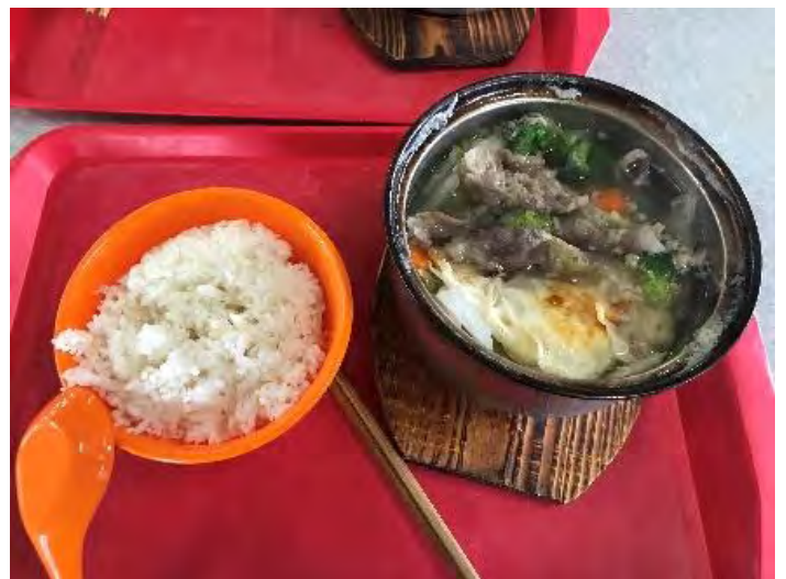
↑西苑學餐二樓的砂鍋 ¥8~15