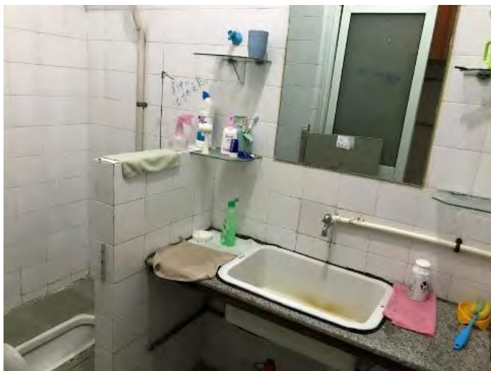
↑寢室內的馬桶和洗手台