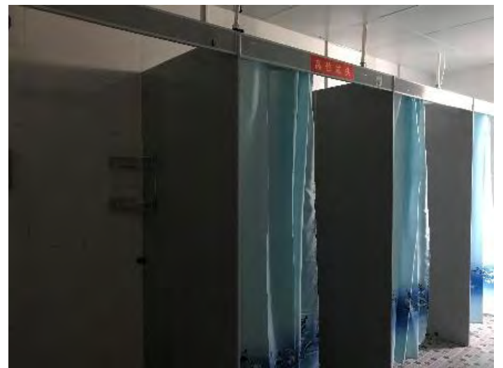
↑宿舍一樓的公共浴室