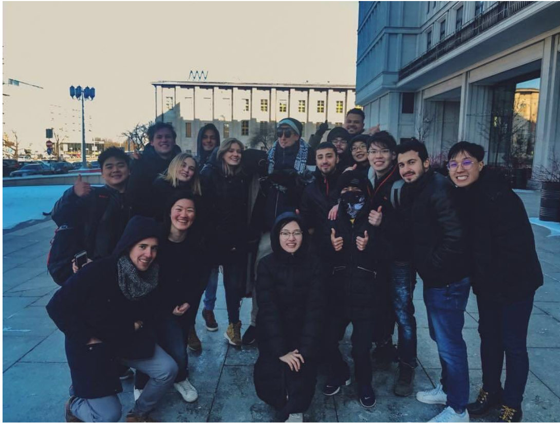
新生週活動小組合影