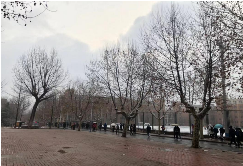
宿舍門前的的不同季節