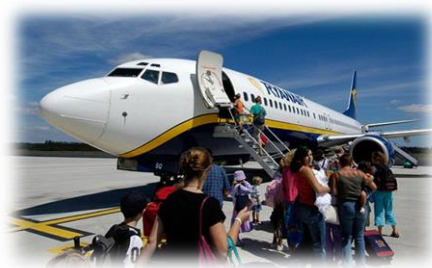
搭乘 Ryanair 需自行 上下機，很特別☺

機票 ：RYANAIR( http://www.ryanair.com/en )、 easyJet( http://www.easyjet.com/en )、 eDreams( http://www.edreams.net/ )、 skyscanner