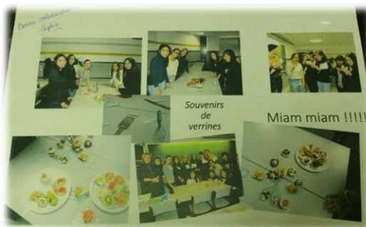
法文課 verrines 料理

法文課的分班是在新生訓練週前請同學登入學校寄信來的連結點進去作測驗，依照答對題數進行分班，題目共 40 題，測驗時間為 10 分鐘，分班結果在新生訓練週的選課時會得知(如果有選法文課的話)，一週上課兩次，每次一個半小時，上課的第一、二週如果對於法文課的難易度有意見，可以請老師幫忙看是要降級或升級(若是升級老師會進行口試評估)再去負責選課處理的處室辦理。我是初級班的法文(答對 9/40)但是老師並不是重頭教起，班上同學也大多都有學過法文，所以被分到初級班的同學還是要注意自己可不可以跟上進度，因為初級班還會再細分成不同的班別。本班的評分標準為出席率、平時小考、上台報告和期末筆試，最後一堂課有做法式料理(verrines)，相當有趣，也為此門課畫下完美的句點。