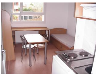
18 m 2 單人房

*宿舍 B1 有洗衣、烘衣間，洗一次 2€，烘一次也 2€，垃圾場也在 B1，因為有資源回收，建議在房間就先分開放，以免拿下來再分會被臭死!B1 也是停車場，如果你有腳踏車也可以停在這。