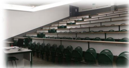
IESEG A201 教室

①課程名稱：LATEST TRENDS IN IT USE (A): THE COMPANY VIEWPOINT