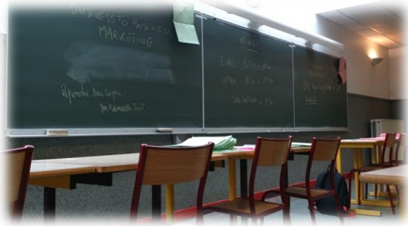
期末筆試的考試場地

建議大家選課一定要先去看一下授課大綱(雖然選課時間很短，但要認真選!)，因為有些課程的要求比較多，如果怕負荷不了同學要好好斟酌，還有密集課通常一班學生有多達 60 人的(看教授收學生的狀況)，但不是你選的課就一定會上，所以經常要去看你的課表和收信，看看你有沒有被踢掉!開課後的一個禮拜可以調整課程，但還要親自在行政人員上班時間去一趟解釋你的狀況，如果處理不好變成曠課就很糟了。