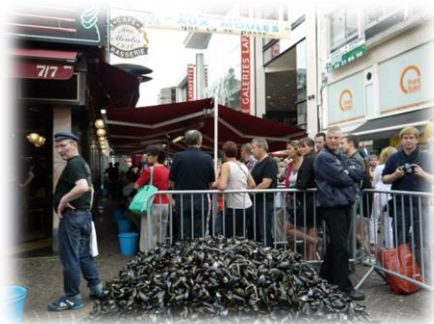
吃完堆起來的淡菜

著名的活動 (la braderie de Lille)，來自歐洲各地的商人把想賣的東西都搬來這裡，整個城市非常熱鬧，人潮瞬間湧入一般，像是台灣的夜市搬到法國的早上一樣，建議上學期來交換的同學把握這個時間把要買的東西一次買齊，因為你可以挖到很多寶!! 這段期間有一項食物大家都會吃：淡菜 Moules，也會有餐廳把吃完的殼疊起來比賽。