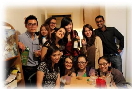
室友一起吃飯聊天

宿舍一樓也有交誼廳(個人信箱也在這)，有電視、足球檯、撞球檯，所以也可以跟朋友下來一樓交流。假如你有朋友來住這幾天，不要讓他去樓下吃早餐，畢竟他沒付費，而且舍監大媽幾乎都記得大家的面孔，外人是會被趕出去的!