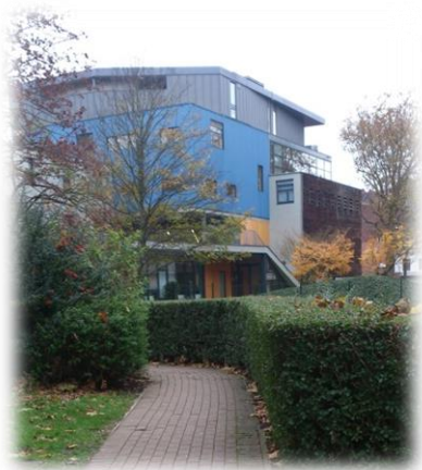
IESEG 校園 B 棟