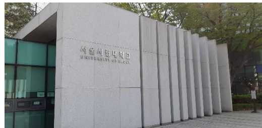
▲首爾市立大學前門