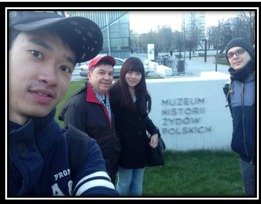
和教授及友人同遊博物館