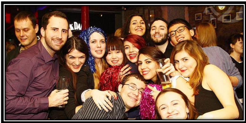
外國留學少不了的夜店派對