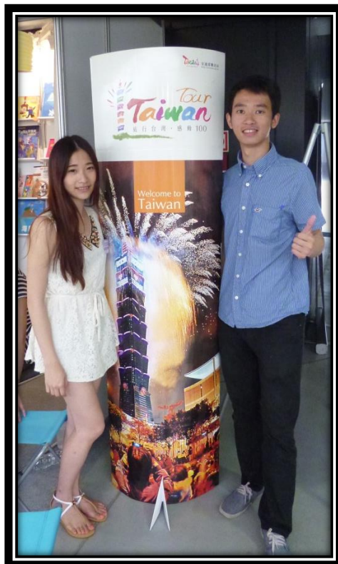
華沙國際書展 宣傳台灣