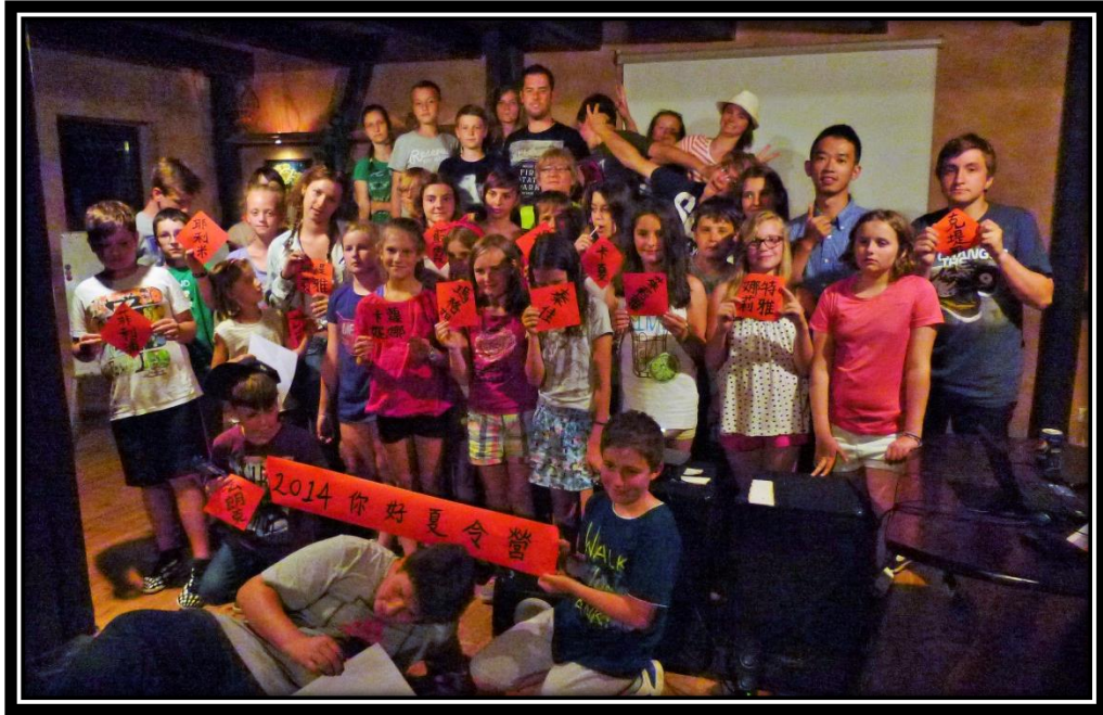
Ni Hao Camp 暑假參與波蘭小朋友的營隊，到郊區當了兩週的中文老師