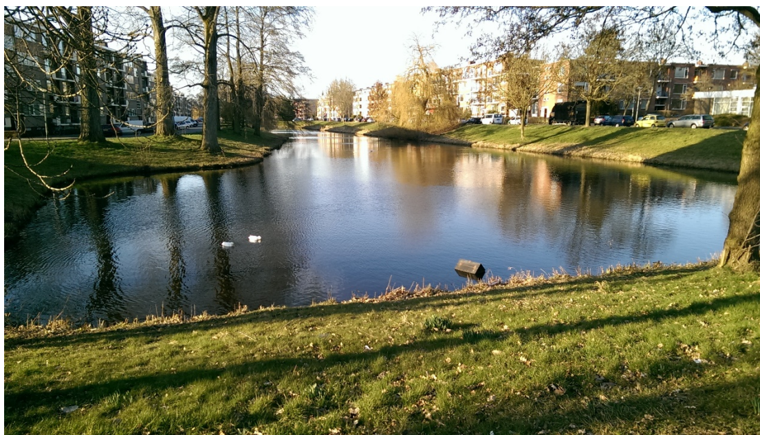
宿舍雖然偏僻，卻處在一個寧靜安詳的社區

三年來也鮮少接觸的活動。後來，在和其他人討論到這個問題時，我找到一個最能說服我的原因：在台灣，學生如果晚上要娛樂找些刺激的活動，可以去唱卡拉OK，夜衝、逛夜市和打保齡球等等，夜生活絕對不缺少新鮮好玩的事；但是對荷蘭人而言，他們沒有上述那些地方可以去放鬆自己，只能藉酒消愁，於是三五成群地朋友上酒吧喝酒聊天，藉由酒精飲料讓自己顯得很興奮，很「瘋狂」。