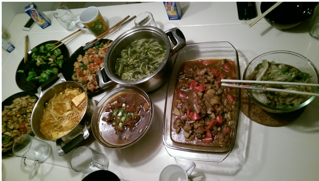
過年時在朋友家聚餐

第一個是和朋友一起煮飯，我剛抵達荷蘭的前幾天，我和我的朋友們每天輪流到對方宿舍一起煮飯，除了閒聊聯絡感情之外，還可以見識不同人掌廚的風格，互相切磋之際，可以看到不同文化及飲食觀的展現。