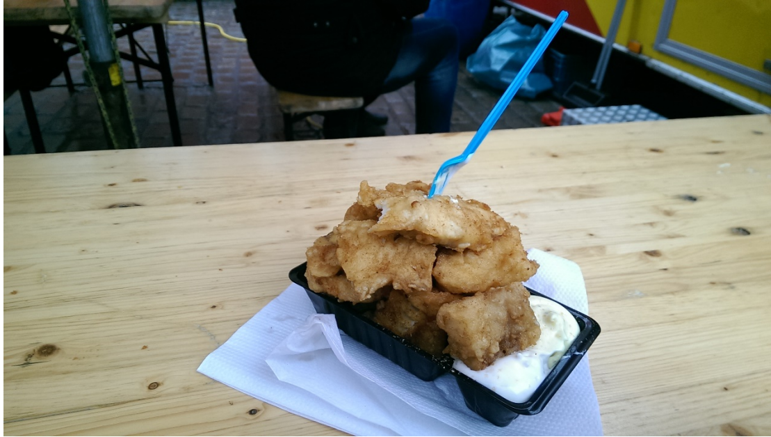
在魚市買的炸魚(kibbling)，一份 4 歐元