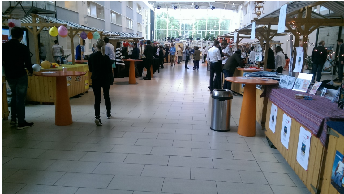
漢斯的交誼廳，剛好遇到活動

一邊聽課一邊吃東西。這樣的行為是很沒禮貌，而且不尊重老師的行為！我在修這門課的時候，如果有同學遲到 10 分鐘以上進教室，老師會狠狠地講一句：“Next time if you’re going to be late, then just don’t come”，或是直接關上門拒絕學生進教室，然後說”Come earlier next time”。在荷蘭，這一點都不奇怪，學生可以自由、放鬆，但是不能沒有規矩！我修的另一門課網路行銷稍微特別一點，老師是德國人，他要我們用 wordpress 架設網頁做行銷，內容是我們組希望讓外界了解的議題或新聞，我們組後來選擇報導尼泊爾大地震帶來的死傷與後續，希望外界可以給予援助。之所以說這門課很妙是因為沒有期末考，而且老師實際授課的次數不超過 5 節，剩下的時間都在和組員討論架設網頁的進展，和有無內容需要修改的。由於我們組的組長，一位保加利亞的女孩，始終堅持她一個人架設網站，不將工作分工給其他人，因此我們其他人都只是打打專有名詞介紹和說明，然後再將文字檔傳給她。真要我說，在這門課裡，我覺得我只是個過客，我揮一揮衣袖，順便拿了 5 學分。